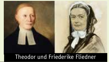
Theodor und Friederike Fliedner

Eventuelle Aktualisierungen zum Programm entnehmen Sie bitte der Homepage der Städte Wiehl und Gummersbach unter Gleichstellung und der lokalen Presse.